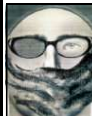
Retrato foi feito com base nas informações da jovem sobrevivente