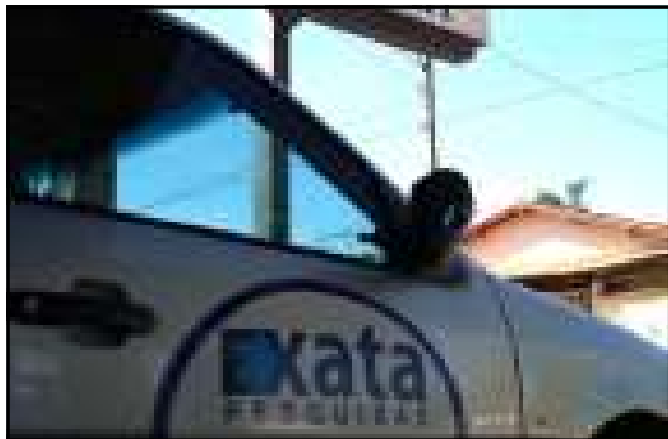
250 em Guapó.

Catatau reclamou da atuação da polícia. Segundo ele, a equipe foi constrangida e obrigada a permanecer por quase oito horas na delegacia. "Usaram da força e nem permitiram que saíssem para almoçar. Tiveram de comer marmiteix, diante da pressão dos tucanos, que desceram de helicóptero na cidade", criticou.