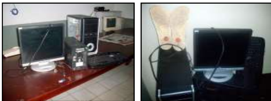
Computador recuperado juntamente com a evidência (chinelo)