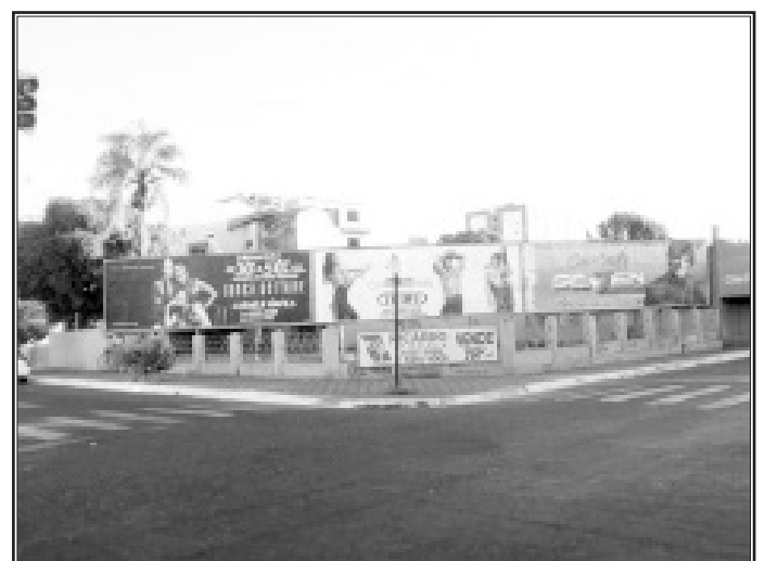
Área de esquina com 797 m² excelente localização no Centro da cidade R$ 1.200.000,00 (Aceita proposta).

Aptº com 1 quarto, sala, cozinha, banheiro, mobiliado, com parque aquático e área com churrasqueira no Condomínio Tainá, R$ 500,00 (já incluso condomínio).