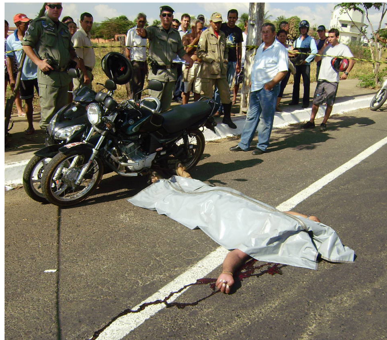
Em menos de 30 dias este é o terceiro suicídio registrado em Caldas Novas com as mesmas motivações.