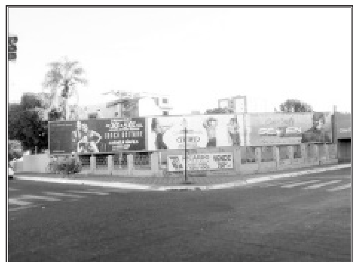
Área de esquina com 797 m² excelente localização no Centro da cidade R$ 1.200.000,00 (Aceita proposta).

Casa com 3 quartos, sala, cozinha, banheiro social, área de serviço e garagem, no setor Itaguaí III R$ 500,00. Salas comerciais (local privilegiado) na Av. Antônio Sanches Fernandes, setor Itaguaí I (Rua da Feira) R$ 700,00. Sala comercial de esquina com 01 banheiro no setor Nova Vila R$ 400,00. Aptº com 4 quartos, sendo 2 suítes, sala/copa, cozinha, banheiro social, área de serviço, garagem e parque aquático, no Condomínio Residencial Akauá em excelente localização R$ 1.300,00 (Incluso Condomínio). Aptº com 1 quarto, sala, cozinha, banheiro, mobiliado, com parque aquático e área com churrasqueira no Condomínio Tainá, R$ 500,00 (já incluso condomínio).