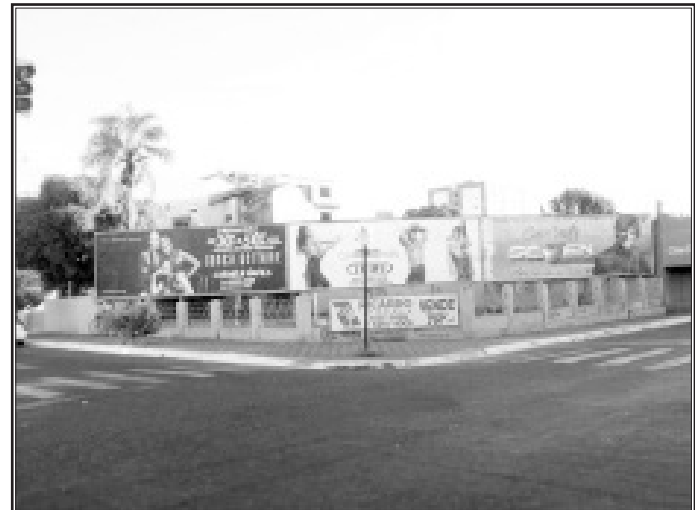
Área de esquina com 797 m² excelente localização no Centro da cidade R$ 1.200.000,00 (Aceita proposta).

Aptº com 1 quarto, sala, cozinha, banheiro, mobiliado, com parque aquático e área com churrasqueira no Condomínio Tainá, R$ 500,00 (já incluso condomínio).