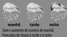
manhã tarde noite Som e aumento de nuvens de manhã. Pancadas de chuva à tarde e à noite.