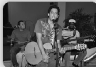
Banda Soul Trio