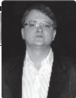
Por Adão Gonçalves