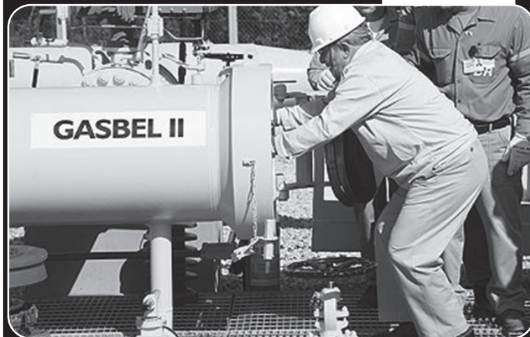
Em Queluzito (MG), o presidente Lula visita gasoduto Rio de Janeiro-Belo Horizonte.