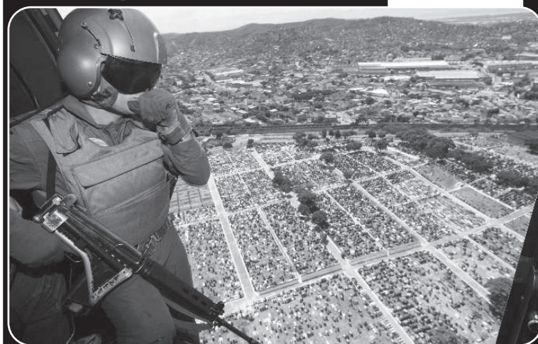
Militares sobrevoam o conjunto de favelas do Alemão.