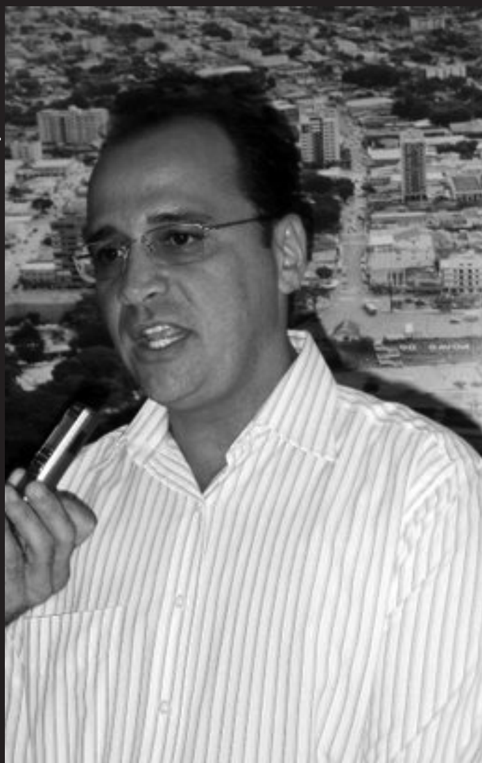
Prefeito Ney Viturino saiu entredicado na eleição da mesa diretora