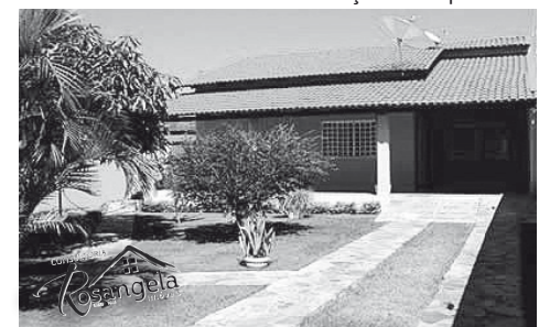
Casa Amarela está localizada no Itaguaí III

LOTES - Itanhanga II, de frente para a rodovia, 04 lotes com 360m² cada, total 1.440 m², excelente para instalação de empresa.