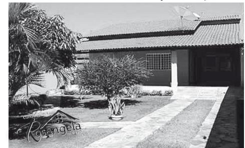
Casa Amarela está localizada no Itaguaí III

LOTES – Itanhanga II, de frente para a rodovia, 04 lotes com 360m² cada, total 1.440 m², excelente para instalação de empresa.