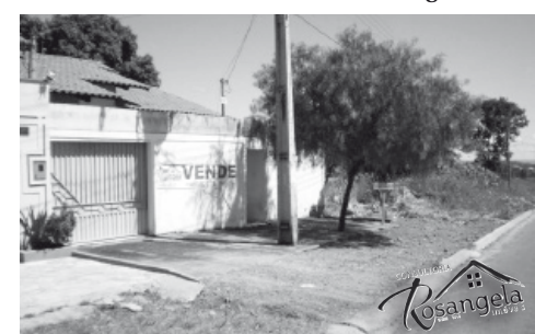
Casa está localizada no Jardim Serrano