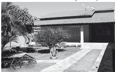
Casa Amarela está localizada no Itaguaí III

LOTES - Itanhanga II, de frente para a rodovia, 04 lotes com 360m² cada, total 1.440 m², excelente para instalação de empresa.