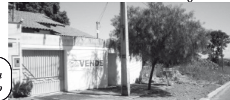
Casa está localizada no Jardim Serrano