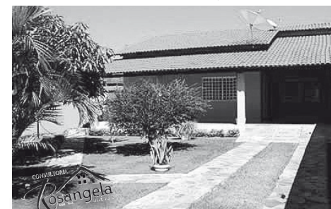
Casa Amarela está localizada no Itaguaí III

LOTES - Itanhanga II, de frente para a rodovia, 04 lotes com 360m² cada, total 1.440 m², excelente para instalação de empresa.