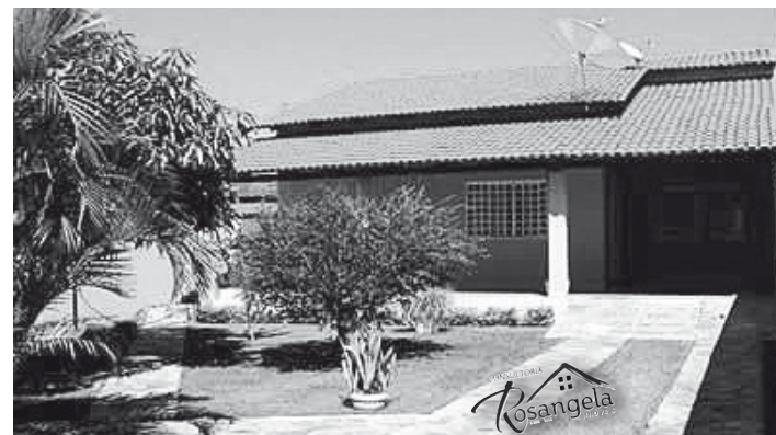
Casa Amarela está localizada no Itaguaí III

HOTEL HOLIDAY HOUSE - Em pleno funcionamento, a 500 m do trevo de Rio Quente, 24.000 m², com 10 chalés de 01 e de 02 quartos mobiliados e equipados com ar condicionado e frigobar, recepção, refeitório, área para churrasco, 02 piscinas, cozinha externa, casa sede, lavanderia, pomar completo, área gramada e ajardinada, 02 baias cavalariças. Retorno garantido de investimento.