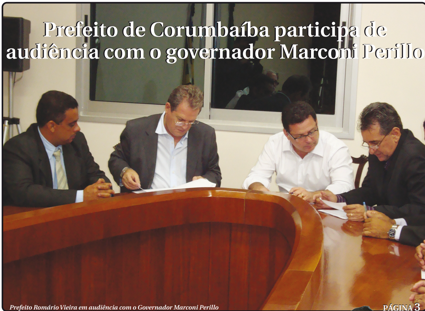
Prefeito Romário Vieira em audiência com o Governador Marconi Perillo