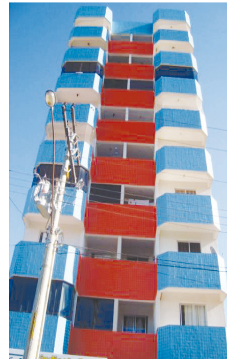
Res. Orquídeas da Serra - Venda de apto de 02 quartos c/ suíte e garagem.

HOTEL HOLIDAY HOUSE - Em pleno funcionamento, a 500 m do trevo de Rio Quente, 24.000 m², com 10 chales de 01 e de 02 quartos mobiilizados e equipados com ar condicionado e frigobar, recepção, refeitório, área para churrasco, 02 piscinas, cozinha externa, casa sede, lavanderia, pomar completo, área gramada e ajardinada, 02 baias cavalariças. Retorno garantido de investimento.