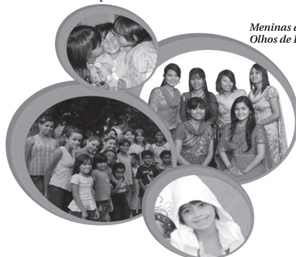
Meninas dos Olhos de Deus

Pastores, Lideres e Dirigentes, divulguem seus eventos neste espaço enviando sua agenda para os e-mails: adao@gazetadoestado.com.br , msn@gospelhd.com.br ou ligando para a Rádio Gospel FM através do telefone: 3454-1049 ou no celular 9248-8883.