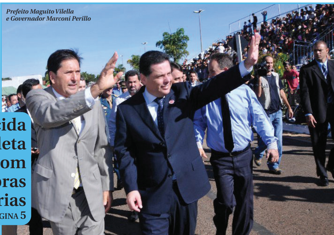
Prefeito Maguito Vilella e Governador Marconi Perillo

Aparecida completa 89 anos com anúncio de obras e melhorias