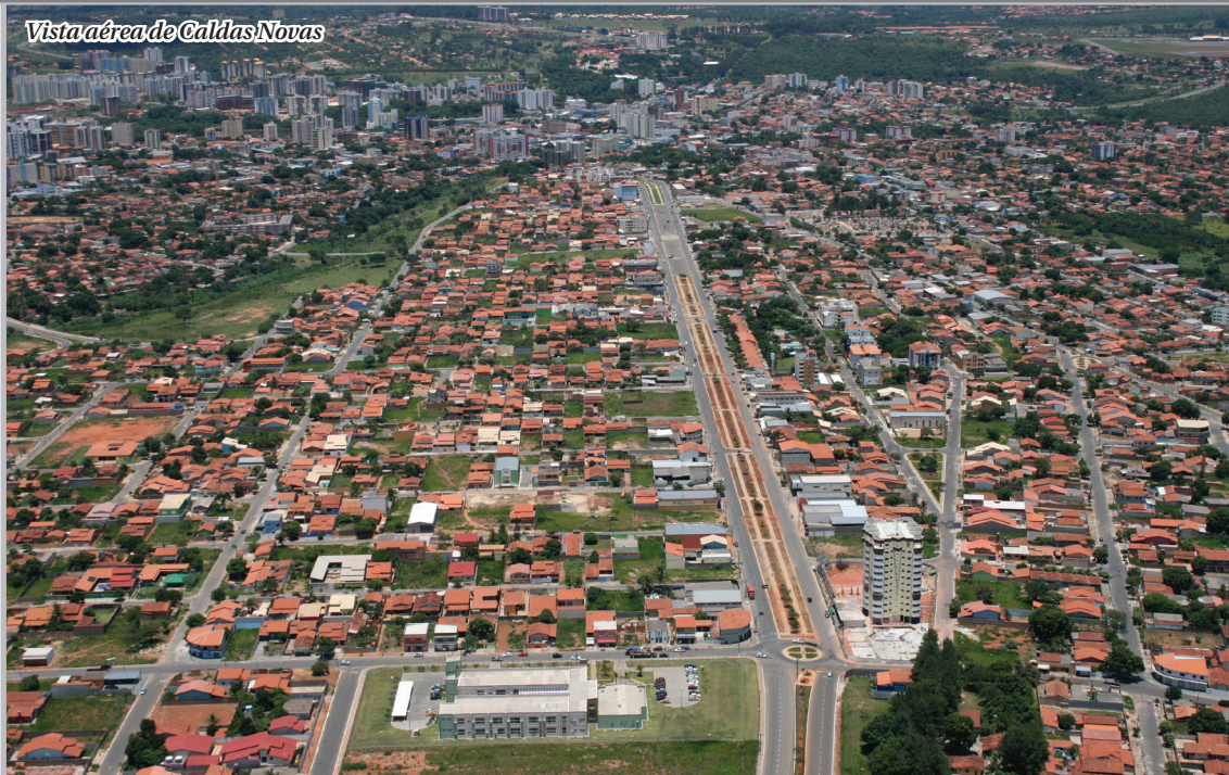
Vista aérea de Caldas Novas

Projeto de concessão de serviços de esgoto para iniciativa privada está na Câmara Municipal