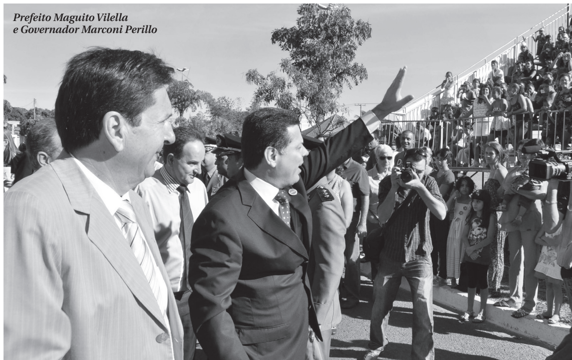
Prefeito Maguito Vilela e Governador Marconi Perillo

O município de Aparecida de Goiânia completou ontem 89 anos e a população ganhou de presente o anúncio de várias benfeitorias para cidade. O governador Marconi Perillo participou do desfile cívico-militar em comemoração ao aniversário de Aparecida e assinou, juntamente com o prefeito, Maguito Vilela, protocolo de intenções para a construção da Alameda da Paz. A alameda vai ligar a Avenida Independência às Avenidas São Paulo e Rio Verde. O valor estimado da obra é de R$ 18 milhões, que serão divididos igualmente entre os governos Municipal e Estadual.