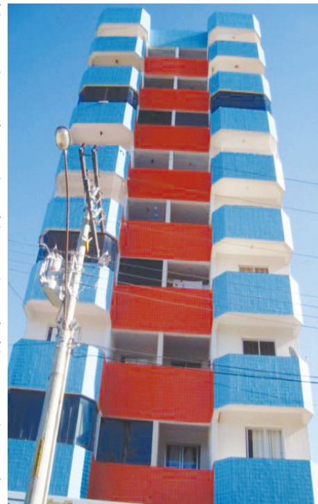
Res. Orquídeas da Serra - Venda de apto de 02 quartos c/ suite e garagem.

HOTEL HOLIDAY HOUSE – Em pleno funcionamento, a 500 m do trevo de Rio Quente, 24.000 m², com 10 chalés de 01 e de 02 quartos mobiliados e equipados com ar condicionado e frigobar, recepção, refeitório, área para churrasco, 02 piscinas, cozinha externa, casa sede, lavanderia, pomar completo, área gramada e ajardinada, 02 baias cavalariças. Retorno garantido de investimento.