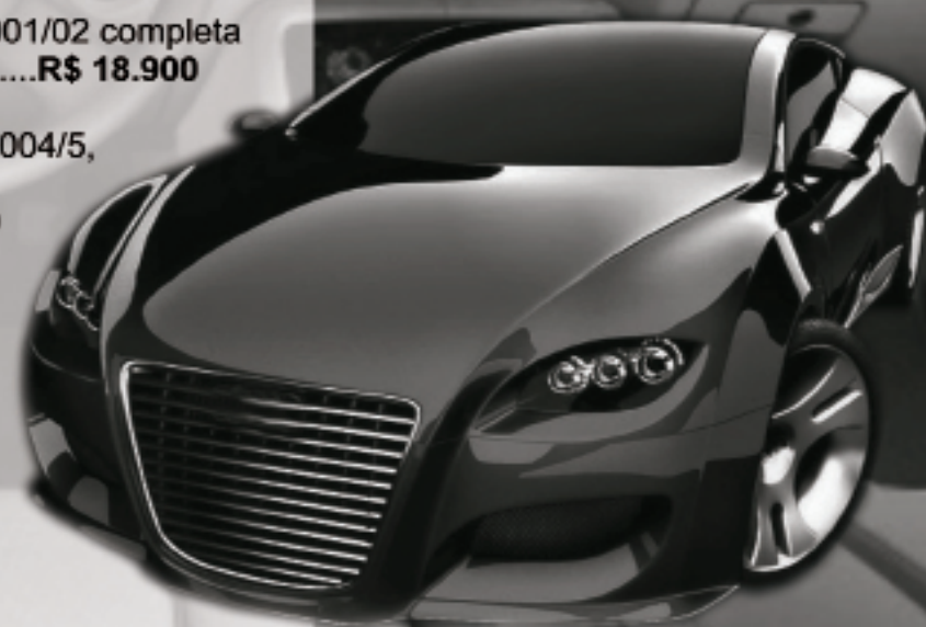
fotos meramente ilustrativas

Voyage Trend 1.0, 2009/09, preta, flex, DH/TE/VE.....R$ 29.000