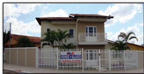
Oportunidade - VENDE OU ALUGA - Excelente sobrado em esquina privilegiada no Bandeirantes. 03 quartos, sendo 01 suíte, 02 sacadas, sala, copa, cozinha, dispensa, área de serviços, garagem coberta, gramado, interfone e portão eletrônico.

PRÉDIO no Rio Quente - Vende-se prédio no Rio Quente, excelente espaço para panificadora, 02 câmaras frias, balcões e prateleiras de inox pronto para panificadora. Com subsolo, área de produção completa, salão de panificação. + ou - 550 m² de área construída com projeção para mais 03 pisos. PREÇO DE OCASIÃO / ACEITA TROCA QUADRA FECHADA - Loteamento no Mansões das Águas Quentes 32 lotes por apenas R$ 70.000,00. ÁREAS - 5000 m² Itaguaí III - Consultar. 1800 m² c/ asfalto Turista II, R$ 60.000,00.