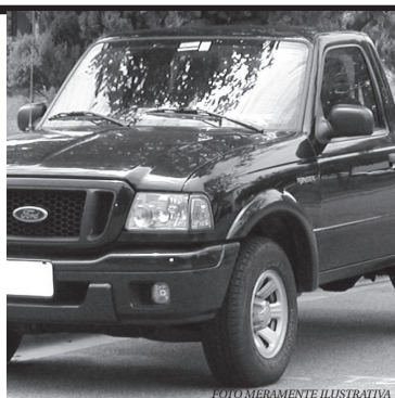
Foto meramente ilustrativa