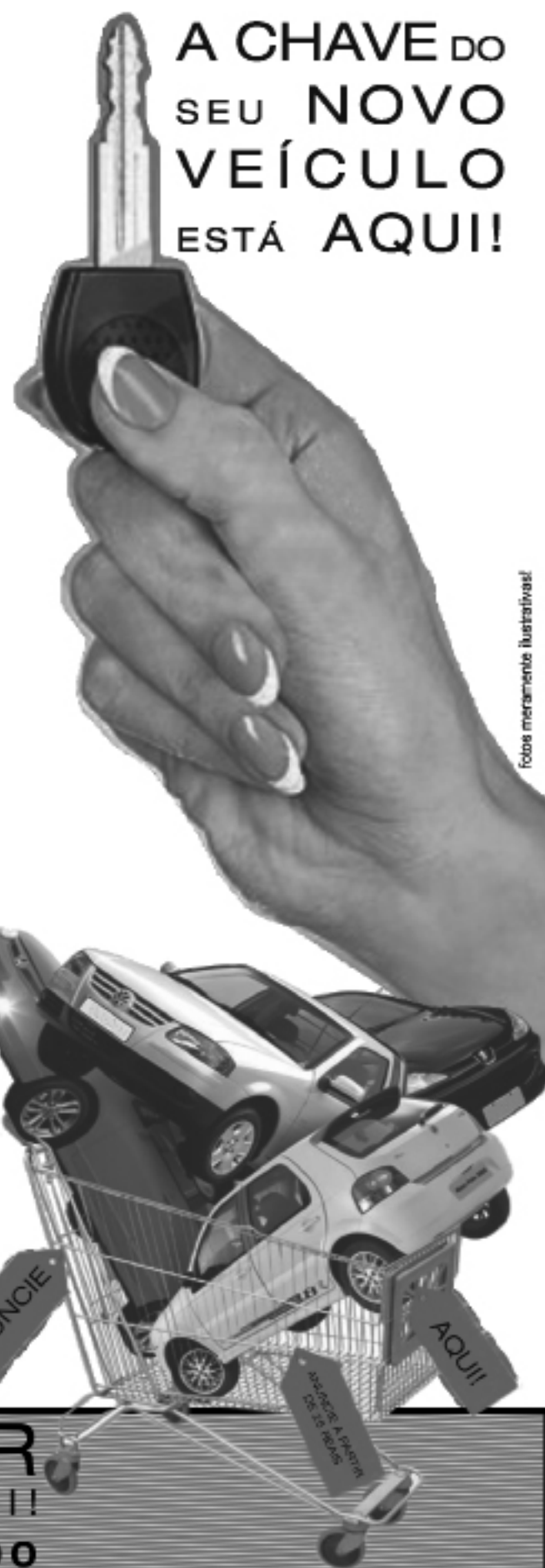
fotos meramente ilustrativas