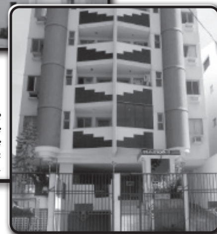
Ótimo apto. com 2 quartos, sacada, suíte e garagem. Excelente área de lazer comum na cobertura.