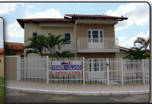
Oportunidade: VENDE OU ALUGA - Excelente sobrado em esquina privilegiada no Bandeirantes. 03 quartos, sendo 01 suíte, 02 sacadas, sala, copa, cozinha, dispensa, área de serviços, garagem coberta, gramado, interfone e portão eletrônico.