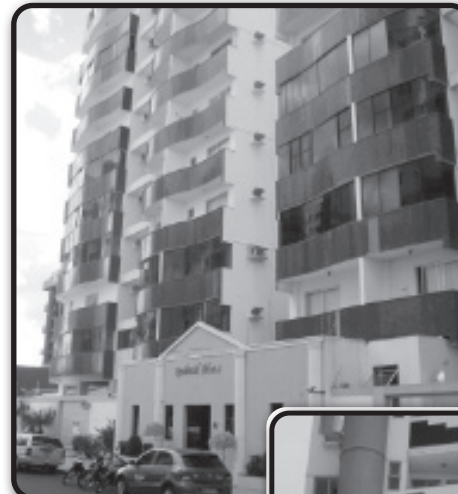
Lindo apto. com 2 quartos, sacada, suíte e garagem. Para quem valoriza espaço e localização.

THERMAL -Apto 3/4 sendo 2 suítes, banheiro, armários, sala, cozinha, área de serviço, sacada e garagem com 2 vagas. Ótima localização. Resid. Saint Paul. Confira o valor.