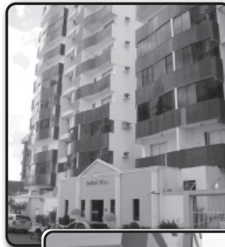
Lindo apto. com 3 quartos, todos são suítes com sacada e garagem. Para quem valoriza espaço e localização.

OESTE -Apto todo mobiliado 2/4 sendo 1 suíte, banheiro, lavabo, sala jantar e tv, cozinha, área de serviço, sacada e garagem. Prédio possui playground, piscina, sauna, bar molhado, elevador e portaria 24hrs. Resid. Kanaxuê. Confira o valor.