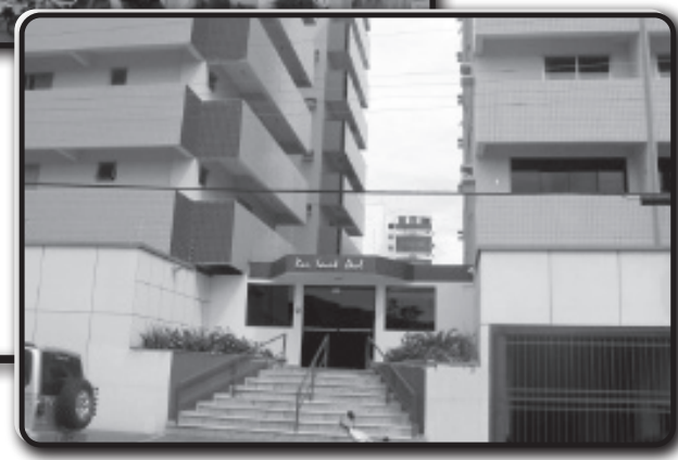
Ótimo apto. com 3 quartos, sacada e garagem. Excelente localização e amplo espaço.