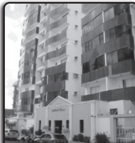
Lindo apto. com 3 quartos, todos são suítes com sacada e garagem. Para quem valoriza espaço e localização.

OESTE -Apto todo mobiliado 2/4 sendo 1 suíte, banheiro, lavabo, sala jantar e tv, cozinha, área de serviço, sacada e garagem. Prédio possui playground, piscina, sauna, bar molhado, elevador e portaria 24hrs. Resid. Kananxué. Confirma o valor