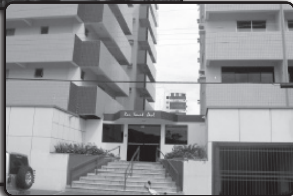
Ótimo apto. com 3 quartos, sacada e garagem. Excelente localização e amplo espaço.