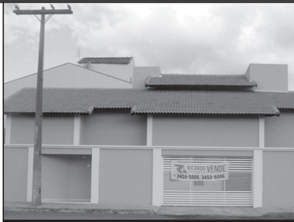
"Casa composta por 3 quartos sendo 1 suíte, sala, copa, cozinha, banheiro social, área de serviço e garagem, em excelente localização no setor Bandeirantes".