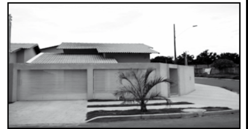
Realize seu sonho da casa própria... linda casa de 3/4, localidade nobre.

CASA NOVA - ITANHANGÁ 03 Quartos, sendo 01 suíte, 01 WC, sala, copa, cozinha, área de serviço, e garagem. TODO NO PORCELANATO, GRAMADA, BOX BLINDEX. (Veja as fotos no site - COD FOTO: 143).