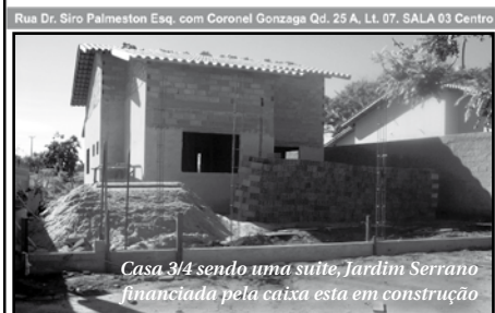
Casa 3/4 sendo uma suíte, Jardim Serrano financiada pela caixa esta em construção

CRECI-CF 13053 CARVALHO CORRETORA DE IMÓVEIS Contatos: (64) 3453-6304-Escritório (64) 9239-6320-Claro (64)9618-8249-Vivo (64)8123-7804-Oi (64)9265-7183-Claro