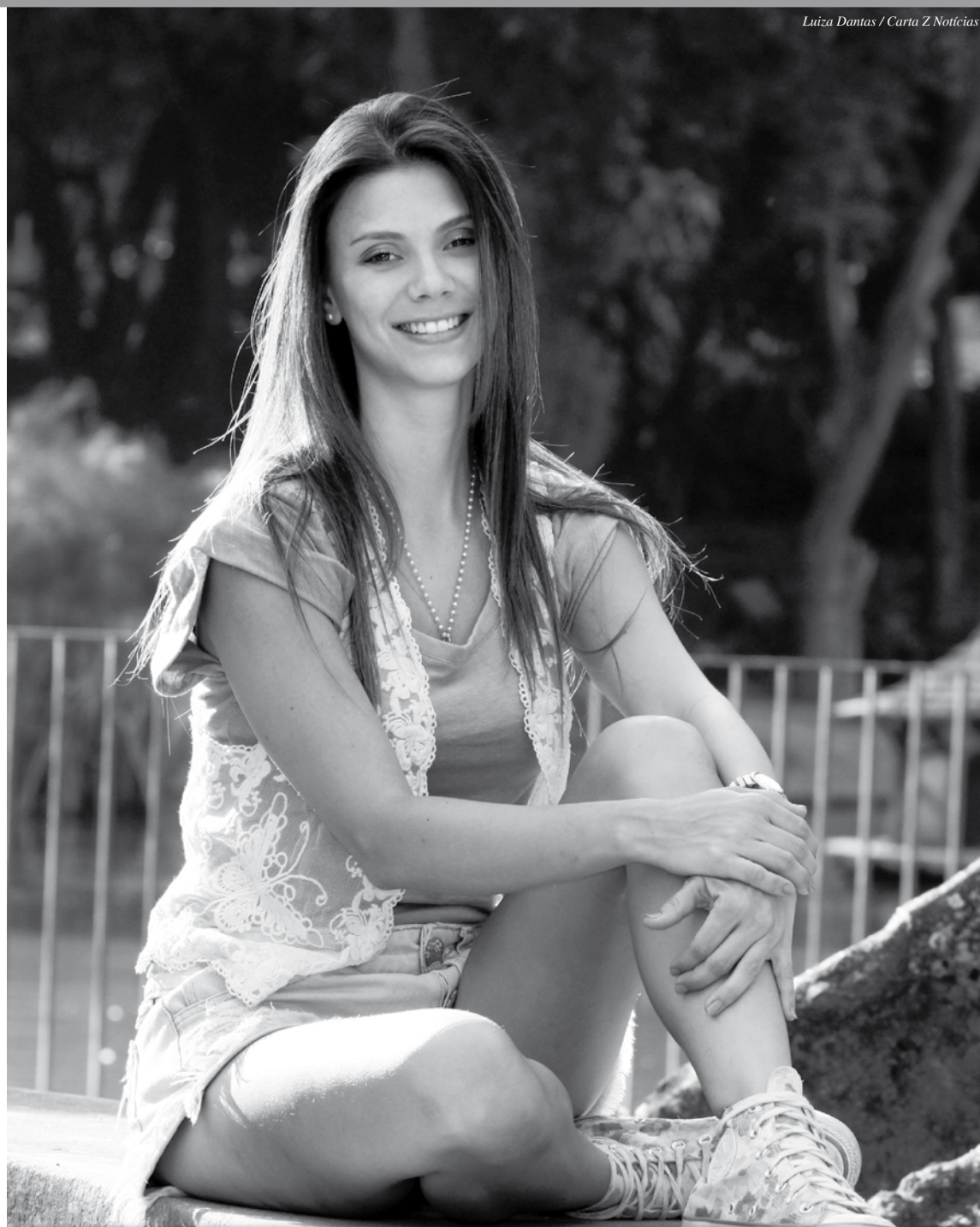
Luiza Dantas / Carta Z Notícias