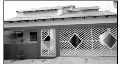
Confira nossos produtos, com certeza você encontrará o que precisa aqui!

CASA NOVA - ITAGUAÍ 03 Quartos, sendo 01 suíte, 01 WC, sala, copa, cozinha, área de serviço, e garagem. (Veja as fotos no site - COD FOTO: 101).