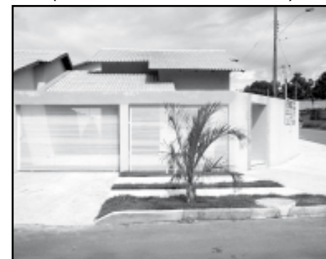
Casa Nova / Caldas do Oeste - 3 quartos sendo 1suíte. (VEJA FOTOS NO SITE COD: 372)