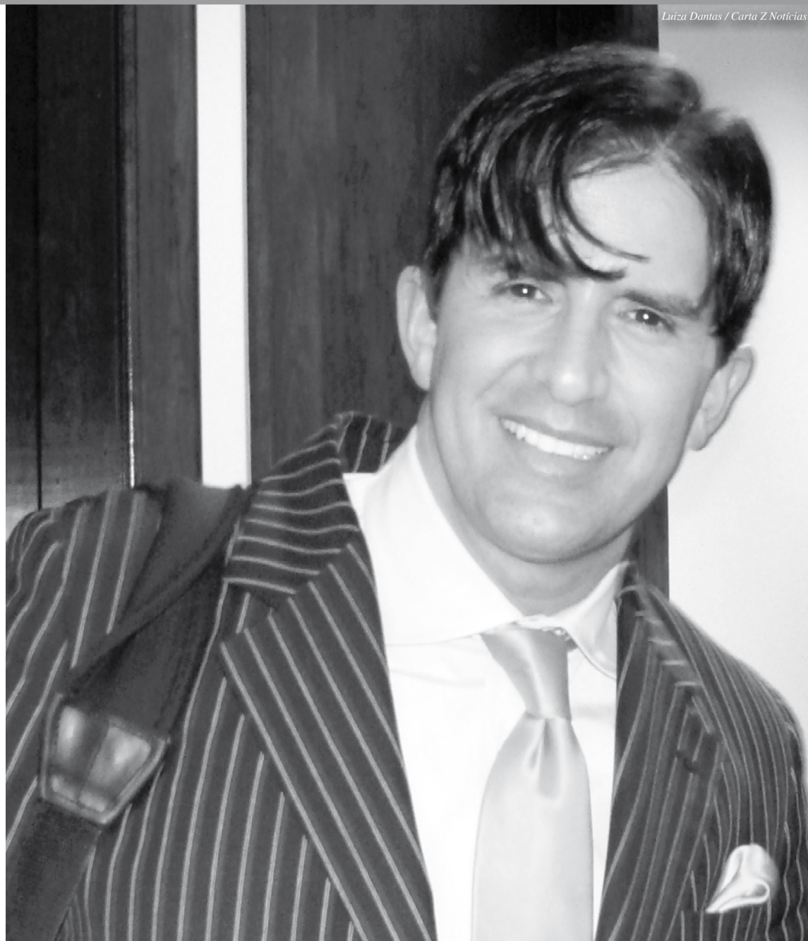
Luiza Dantas / Carta Z Notícias