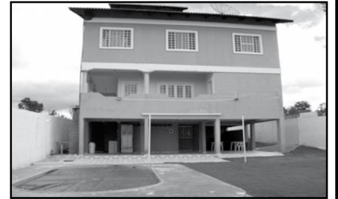
Lindo sobrado com área de lazer. Ótima oportunidade

CASA NOVA - ITANHANGÁ 03 Quartos, sendo 01 suíte, 01 WC, sala, copa, cozinha, área de serviço, e garagem. TODO NO PORCELANATO, GRAMADA, BOX BLINDEX. (Veja as fotos no site - COD FOTO: 143)