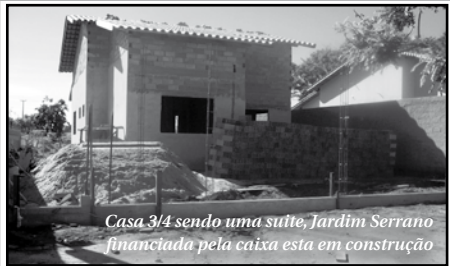
Casa 3/4 sendo uma suíte, Jardim Serrano financiada pela caixa esta em construção

Rua Dr. Siro Palmeston Esq. com Coronel Gonzaga Qd. 25 A. Lt. 07. SALA 03 Centro