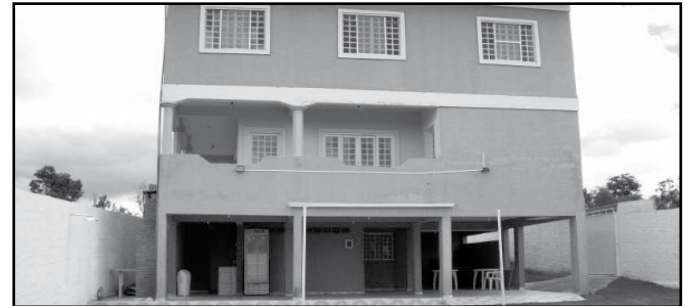
Lindo sobrado com área de lazer. Ótima oportunidade

CASA NOVA- ITANHANGA 03 Quartos, sendo 01 suíte, 01 WC, sala, copa, cozinha, área de serviço, e garagem. TODO NO PORCELANATO, GRAMADA, BOX BLINDEX. (Veja as fotos no site - COD FOTO: 143)