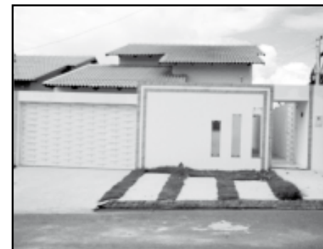
Casa Nova / Caldas do Oeste - 3 quartos sendo 1suíte. (VEJA FOTOS NO SITE COD: 371)

CHACARA BEIRA DO LAGO - Casa: 02 quartos, sala, cozinha, falta acabamento. Área: 2.500m 2 . (VEJA FOTOS NO SITE COD: 142)