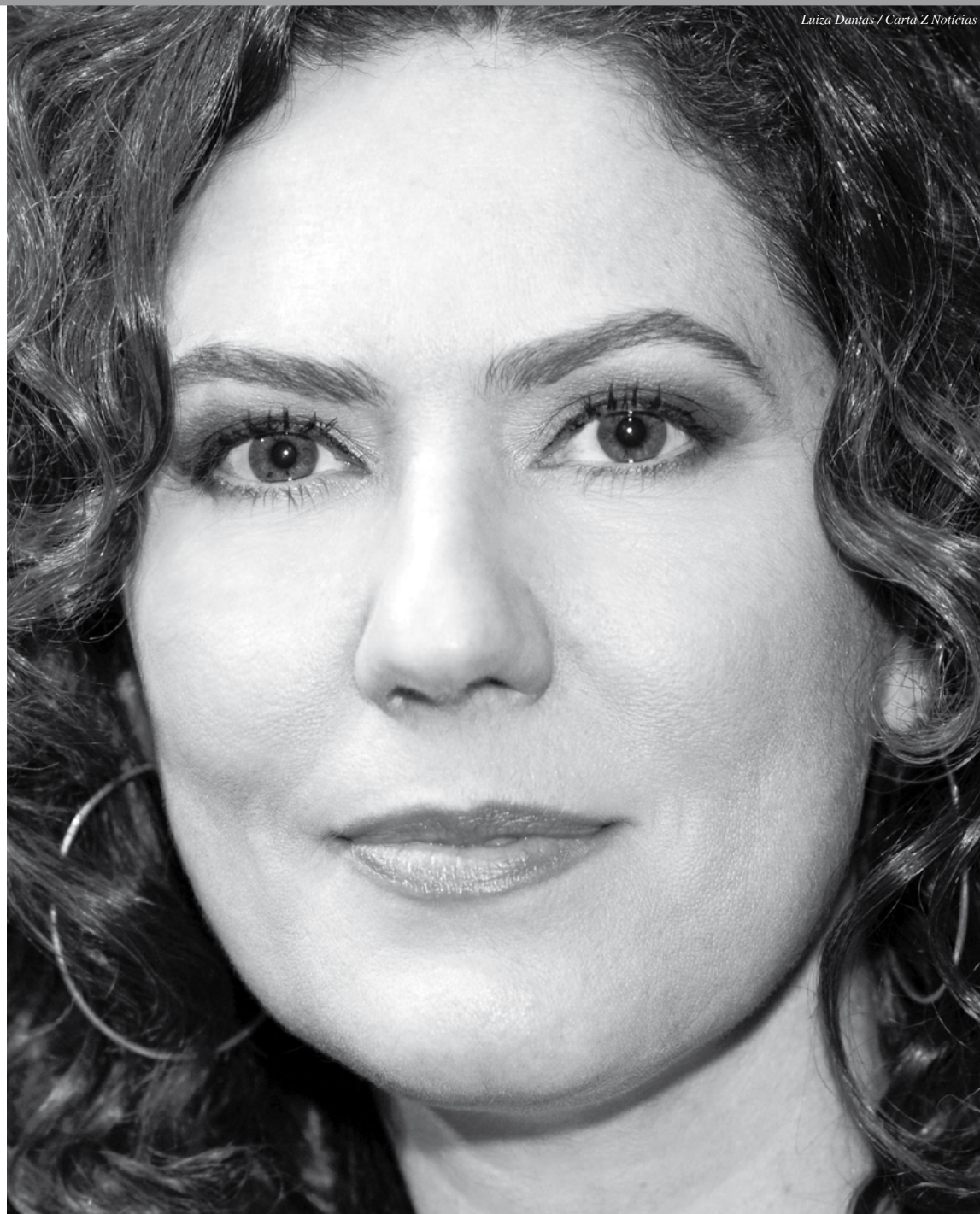
Luiza Dantas / Carta Z Notícias