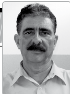
Por: Elias Pires

Então, se não for possível substituir todas as embalagens de plástico comum - e parece que tudo é embalado com plástico - o que precisamos é nos educar no sentido de separar todo esse plástico para ser reciclado, de maneira que não vá parar nos aterros sanitários, nos esgotos, nos rios, no mar, etc. E urgente, porque o meio ambiente já não aguenta tanto plástico. Pelo prazo que ele precisa para se degradar, os primeiros produtos feitos de plástico, aqueles do início do uso do plástico ainda não começaram a se decompor. Já imaginaram quanto plástico está acumulado na natureza?