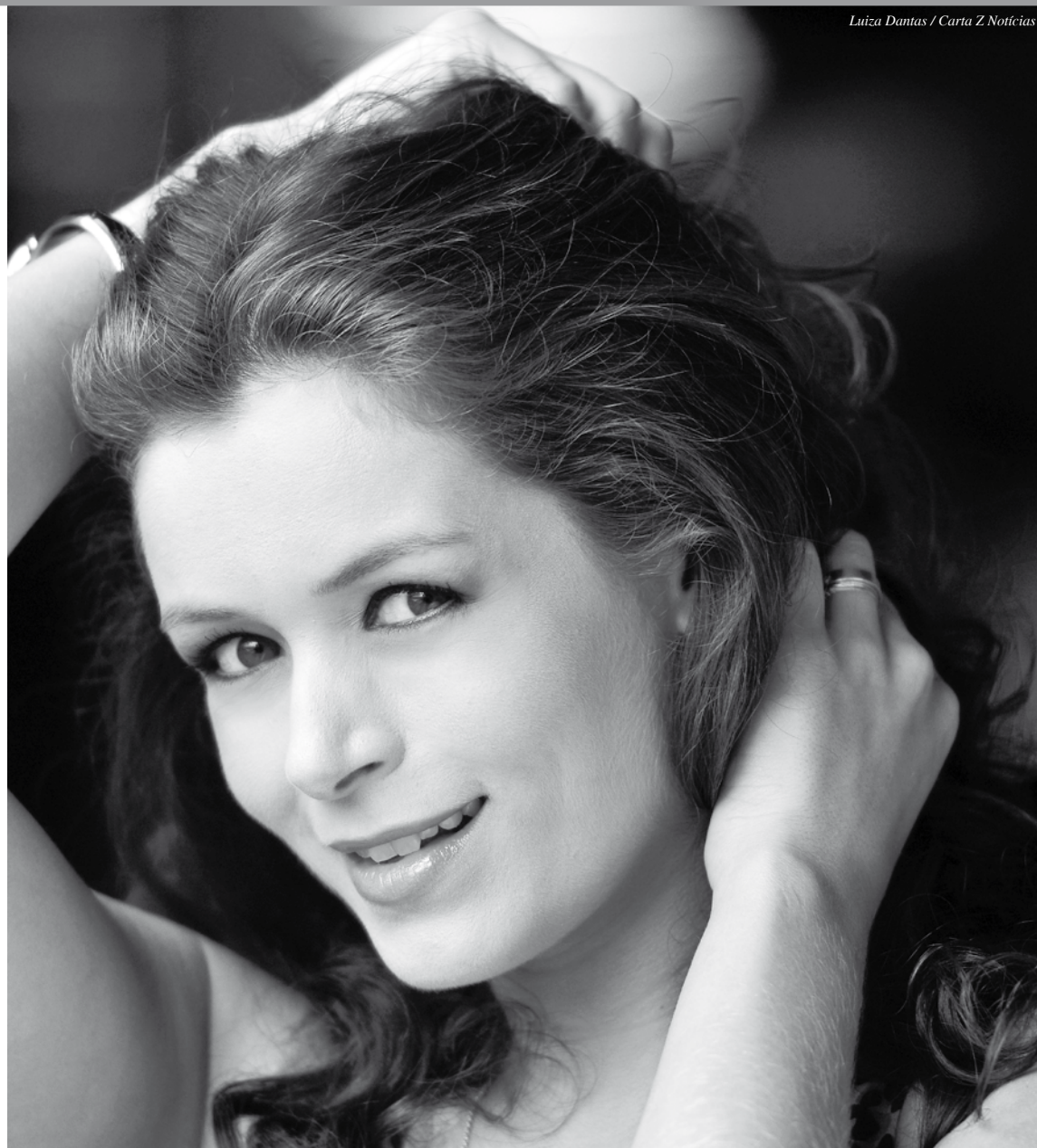
Luiza Dantas / Carta Z Notícias