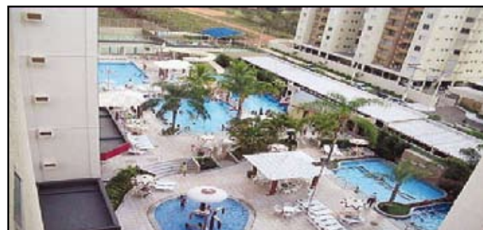
EXCELENTE APARTAMENTO, com 02 quartos, sendo 01 suíte, 01 banheiro social, sala, cozinha, área de serviços, sacada e 01 box de garagem, 8º andar, Residencial Privé das Thermas I. PREÇO DE OCASIÃO

Danilo Imóveis CRECI: 8.908 (64) 3453-2826 / 8403-6927 ALUGUEL SALA COMERCIAL contra esquina no Setor Jardim dos Turistas, atrás da Pousadinha Valor R$ 400,00. APTO. 1/4, sala, cozinha, banheiro, ao lado do pronto socorro. R$ 350,00 VENDA CASA no Caldas do Oeste, 2/4 sendo uma suíte, banheiro social, sala, cozinha, área na frente e no fundo, água R$ 40.000,00. APTO 1/4, Residencial Renaissance ágio R$ 55.000,00 C H A L É de 2/4, sala, cozinha, garagem, banheiro social Qd 127 mansões R$ 70.000,00 LOTE nas Mansões das Águas Quentes R$ 10.000,00 LOTE no Setor Belvedere R$ 22.000,00 LOTES 2 no Itanhaguá I, R$ 70.000,00 Cada. LOTE no Caldas do Oeste com barracão no fundo R$ 70.000,00. LOTE Setor Portal das Águas Quentes R$ 15.000,00