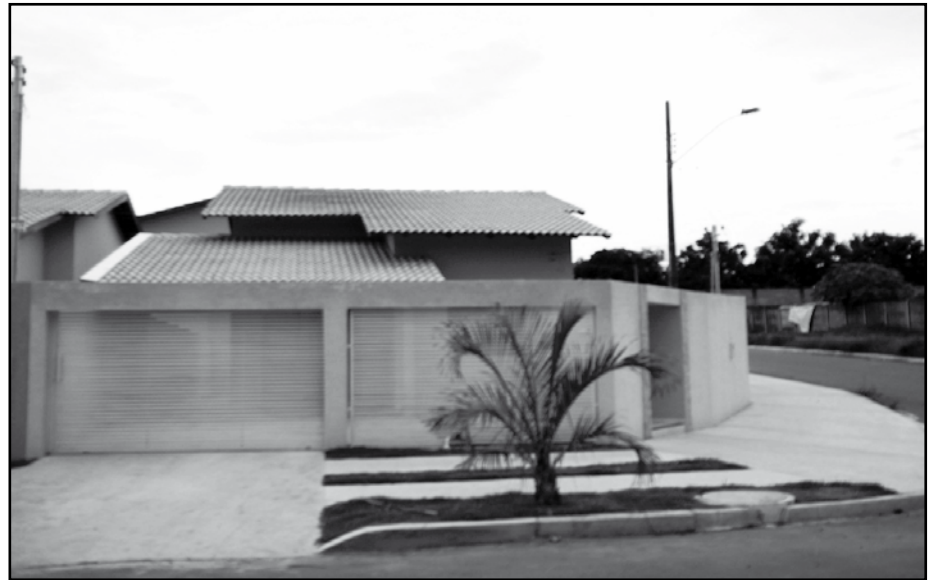
"A Guilherme Negócios Imobiliários ajuda você a realizar o sonho da casa própria. Confira nossos produtos"

APTO TOULLON - OPORTUNIDADE - R$ 100.000,00 1/4, 01 WC, sala, cozinha americana, área de serviço, garagem. TODO MOBILIADO, ÁREA DE LAZER C/ PISCINAS, JACUZI, CHURRASQUEIRA. (Veja as fotos no site - COD FOTO: 90)