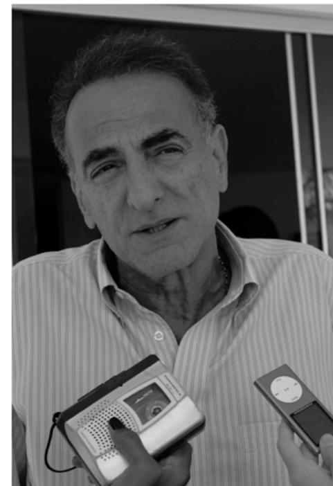
Jardel destaca que a união é fundamental para o desenvolvimento de toda a sociedade

O presidente da Assembleia dedica o dia a visitar lideranças, empresários, comerciantes e trabalhadores de Catalão e região. "Precisamos somar forças para trabalharmos em favor do Sudeste goiano", comenta.