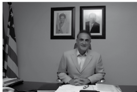
Presidente Jardel Sebba sempre defende o diálogo democrático entre população e o Legislativo

Jardel recebe no gabinete da presidência da Assembleia, autoridades, lideranças políticas e comunitárias. "O Legislativo é o poder mais próximo do cidadão. Temos de estar abertos à conversação com os mais diversos segmentos da sociedade."