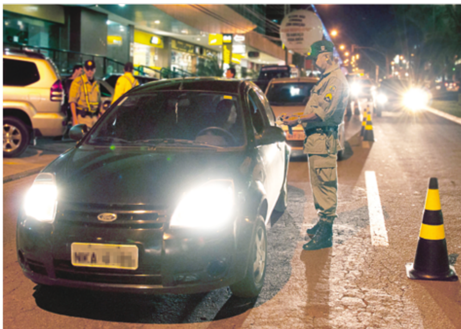
Programa Balada Responsável atuou em 15 municípios durante o carnaval