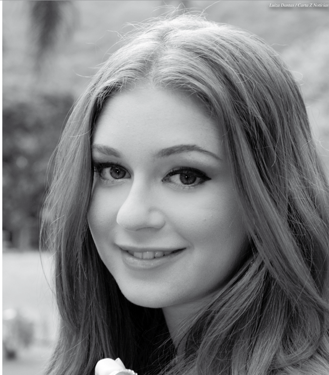
Luiza Dantas / Carta Z Notícias