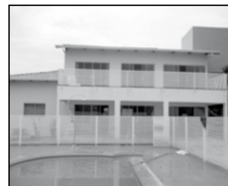
Itanhanga II (VEJA FOTOS NO SITE COD: 394)