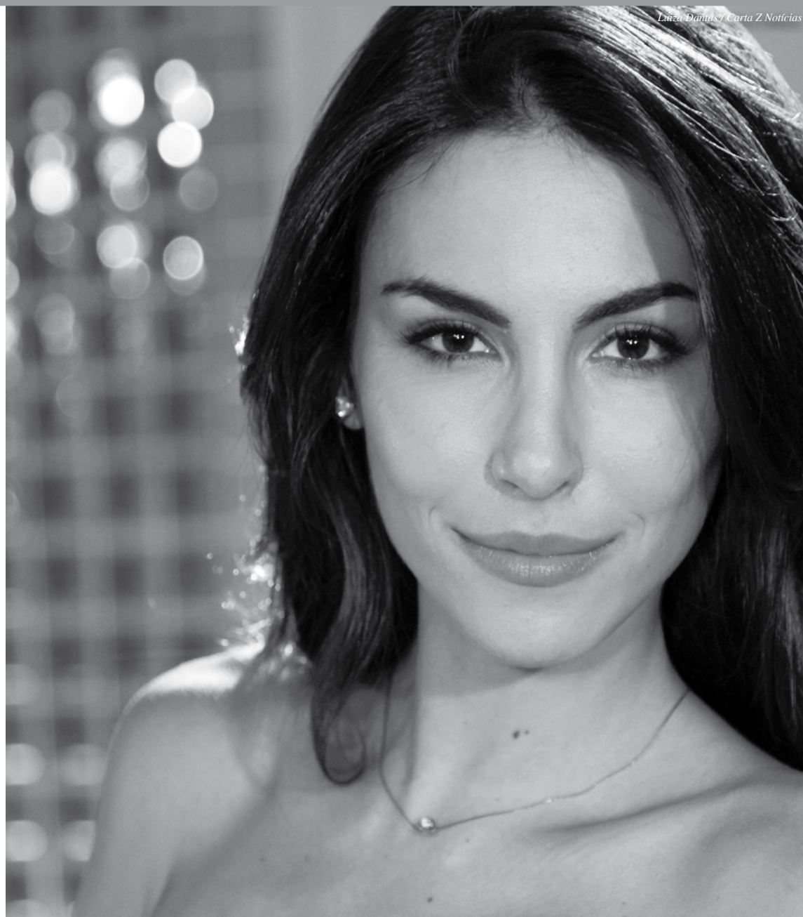
Laís Portela / Carta Z Notícias