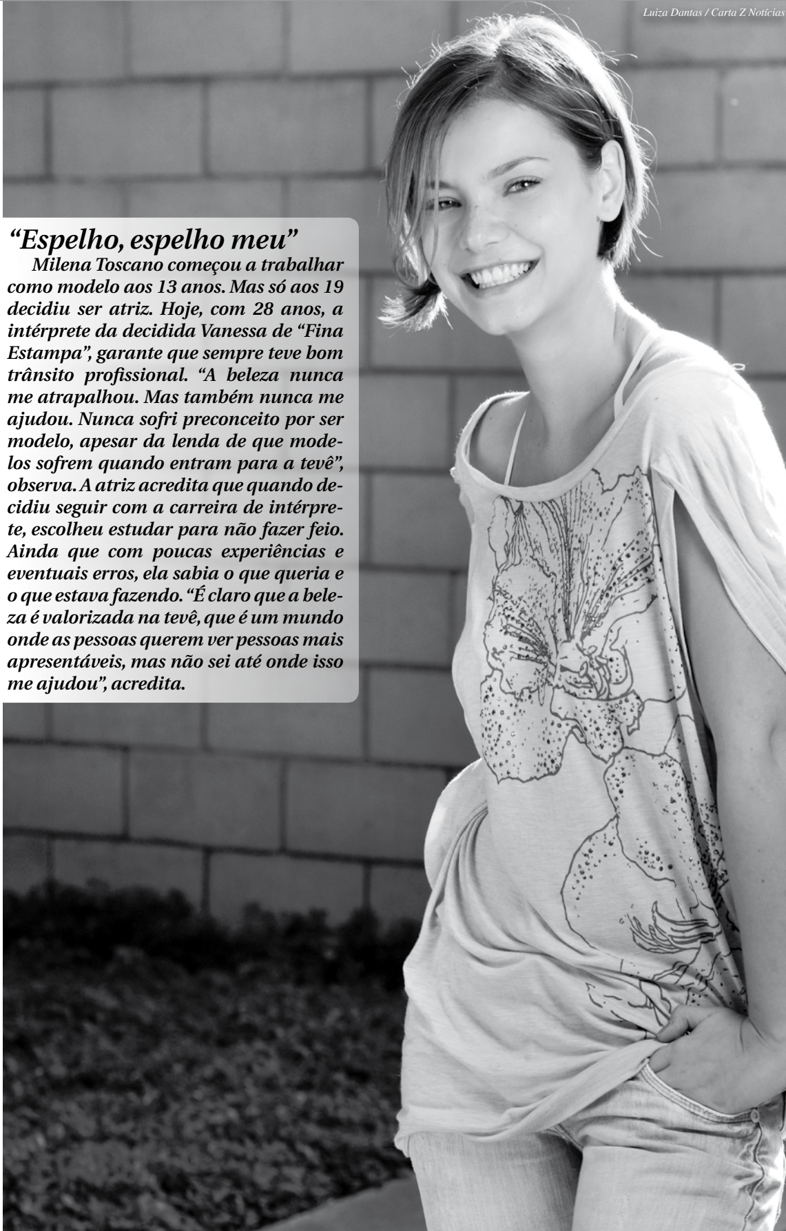
Luiza Dantas / Carta Z Notícias