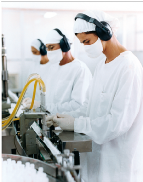
Indústria farmoquímica apresenta crescimento de 104%

O excelente desempenho da economia goiana reflete, sobretudo, a forte ação indutora do Governo de Goiás. Em 2011, mais de R$ 10 bilhões foram captados em investimentos públicos e privados. Goiás é o Estado líder absoluto no Centro-Oeste em captação de recursos do FCO, com mais de 37% dos recursos disponíveis, totalizando R$ 2,064 bilhões. A GoiásFomento voltou a ser impor-