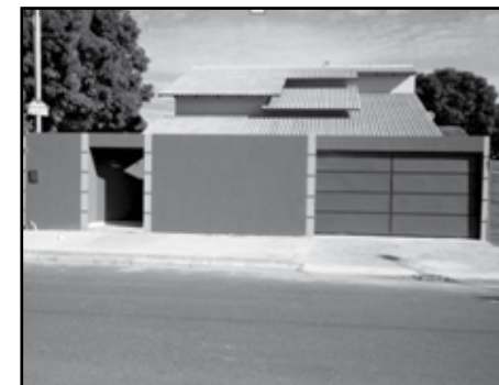
Itaguai III (VEJA FOTOS NO SITE COD: 418)

CHALÉ - MANSÕES DAS ÁGUAS QUENTES / 1 suíte, sala, cozinha, banheiro social, área de serviço coberta, garagem para 3 carros, com moveis embutidos. (VEJA FOTOS NO SITE COD: 387)