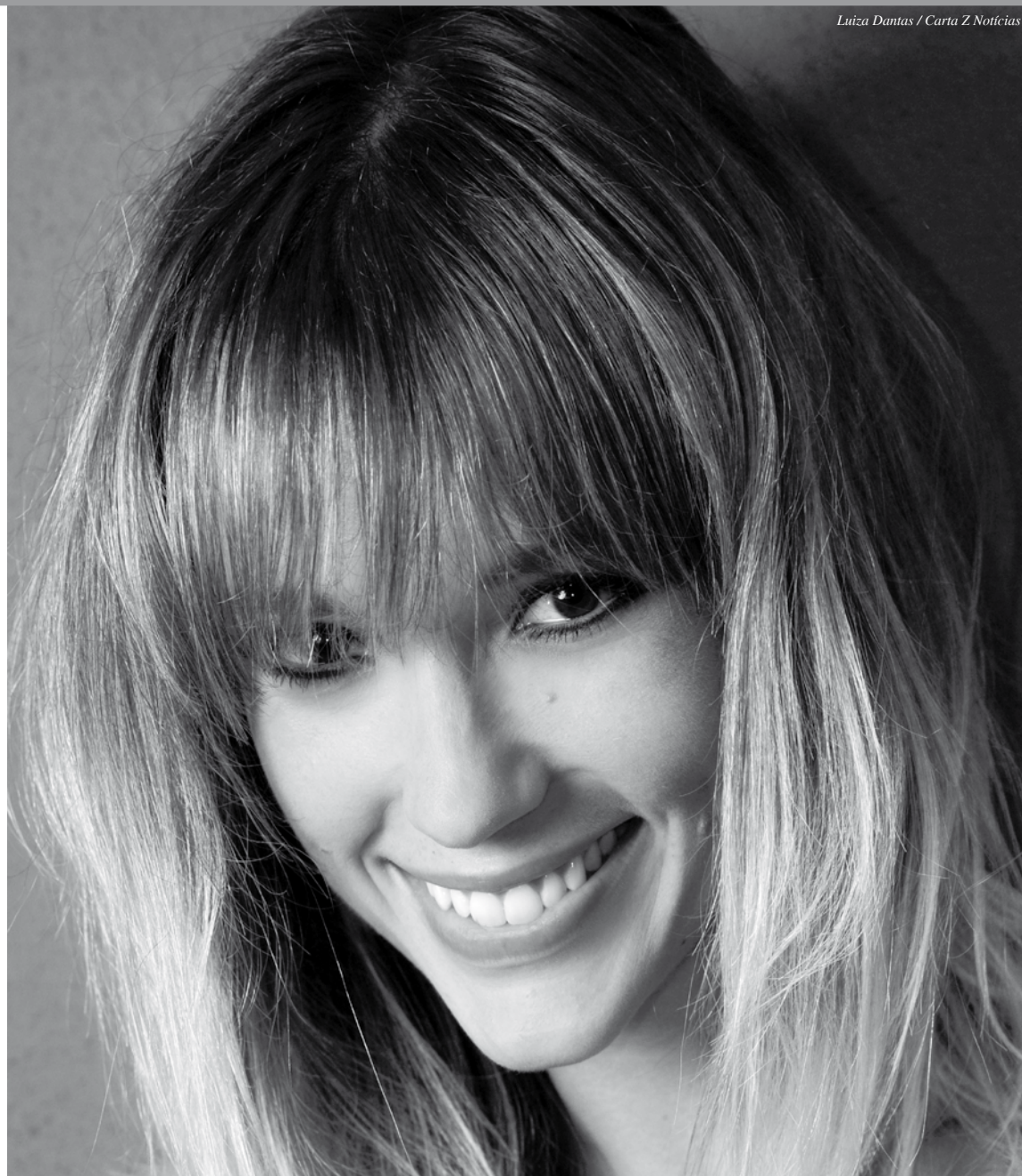
Luiza Dantas / Carta Z Notícias