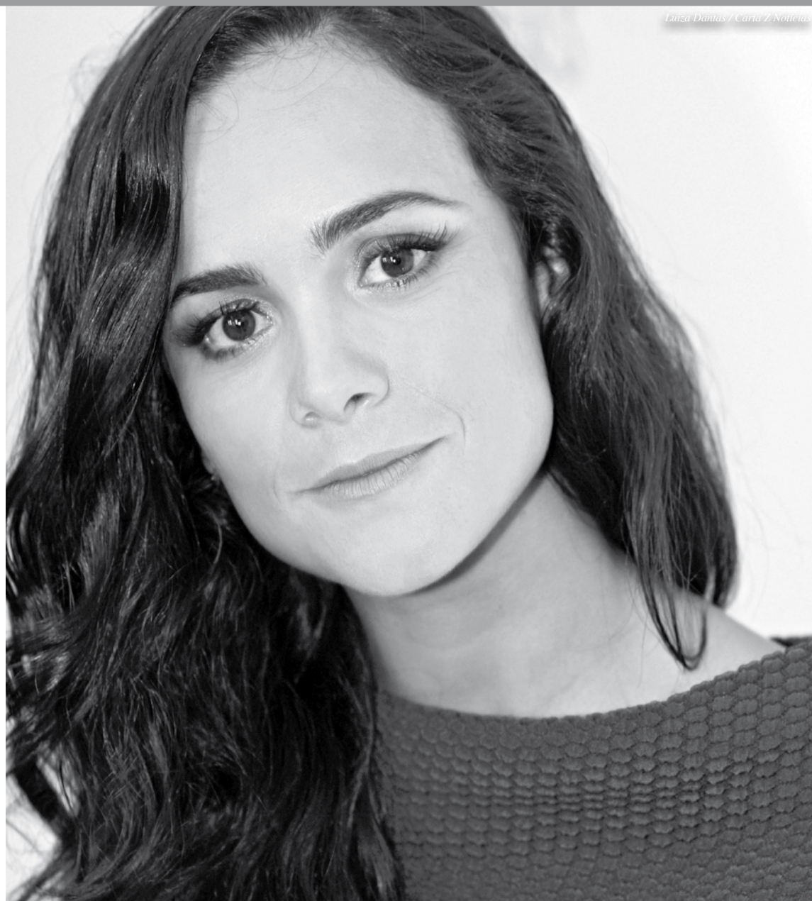
Luiza Damás / Carta 2 Notícias