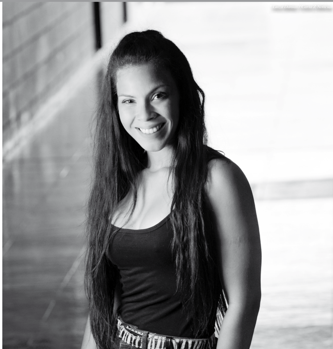
Luiza Dantas / Carta 2 Notícias