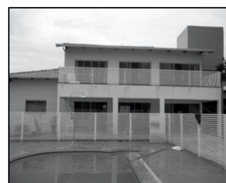
Itanhangá II (VEJA FOTOS NO SITE COD: 394)

DON FELIPE (VEJA FOTOS NO SITE COD: 391)