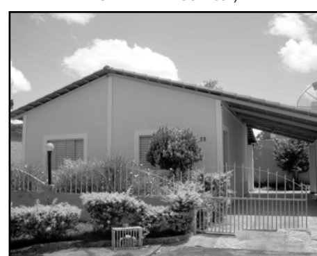
Itaguaí III (VEJA FOTOS NO SITE COD: 476)

CHALÉ - MANSÕES DAS ÁGUAS QUENTES / 3 suítes. - Toda na laje. (VEJA FOTOS NO SITE COD: 384)