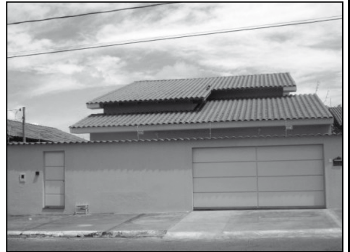
“A Guilherme Negócios Imobiliários ajuda você a realizar o sonho da casa própria. Confira nossos produtos”

Novo conceito no ramo imobiliário, financiamento habitacional Minha Casa Minha Vida, ótima oportunidade!