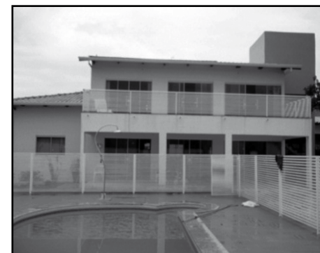
Itanhangá II (VEJA FOTOS NO SITE COD: 394)

DON FELIPE (VEJA FOTOS NO SITE COD: 391)