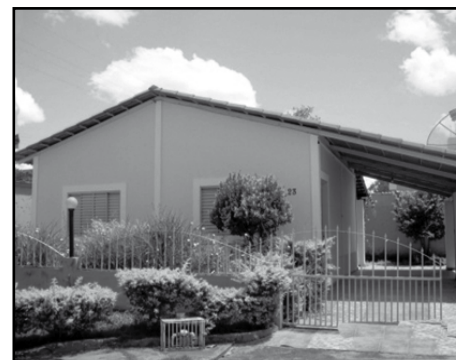
Itaguaí III (VEJA FOTOS NO SITE COD: 476)

CHALÉ - MANSÕES DAS ÁGUAS QUENTES / 3 suítes. - Toda na laje. (VEJA FOTOS NO SITE COD: 384)