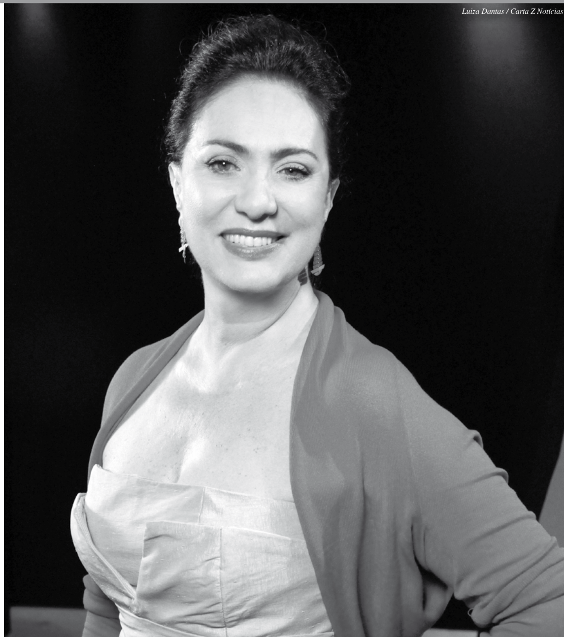
Luiza Dantas / Carta Z Notícias