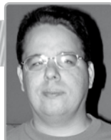
Por: João Batista Jr.

novas câmeras Lumix feito pela Panasonic na semana passada, além da DMC-G5, DMC-LX7 e DMC-LZ200, o pessoal de Osaka também apresentou a Lumix DMC-SZ5, uma câmera de bolso com Wi-Fi 802.11b/g/n integrado.