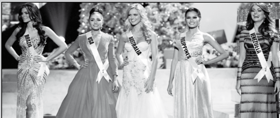
Brasileira foi até a final, ao lado das candidatas dos Estados Unidos, Austrália, Filipinas e Venezuela

A bela vitoriosa da vez foi a norte-americana Olivia Culpo. Quem também esteve bem perto de conquistar o