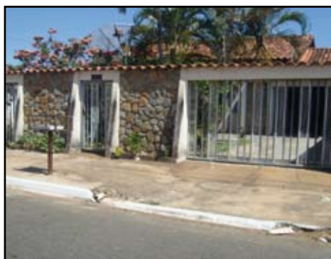
Casa no Itanhanga casa com ótima localização

Venha e nos faça uma visita temos uma promoção especial para você!