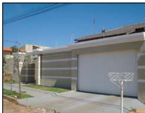
Ótima Casa - 3/4 sendo 2 suíte, 2 WC, Sala, Copa, Coz., Área de serviços, portão eletrônico, Churrasqueira, lavanderia, acabamento de primeira e garagem para 4 carros Endereço: Setor itaguaí II