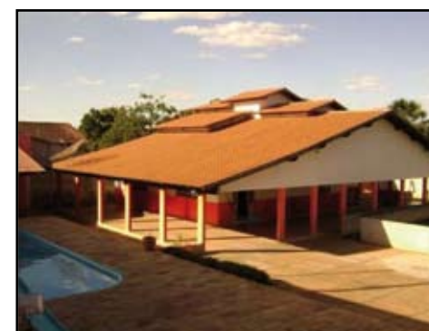
Casa em tres lotes com 4 quartos, 2 suítes, 2 banheiros, sala, copa, varanda, churrasqueira, barzinho, quadra poliesportiva, campo society, piscina, cozinha, área de serviço, garagem e quintal.