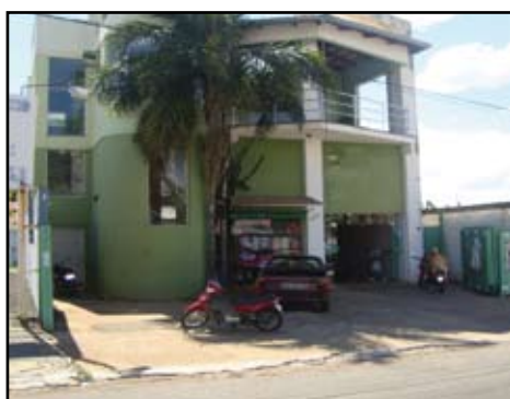
Ponto Comercial Vendo ótimo ponto comercial Avenida Bento de Godoy