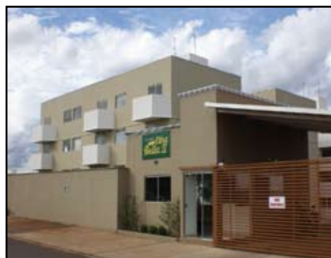
Apartamento Residencial 2/4, arários, guarda-roupas embutidos, estacionamento e recepção 24h. Ilha Bella II