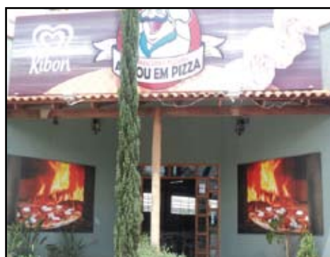
Ponto Comercial-Pizzaria e Restaurante com ótima localização, Salão com capacidade para 60 jogos de mesas, Play Ground, Buffet com 10 cubas quentes, e 14 frias, Churrasqueira na brasa com 25 espeto, e estacionamento próprio no Centro.