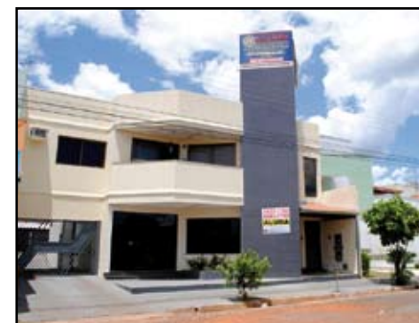
SOBRADO NO BANDEIRANTE - Excelente Sobrado no Setor Bandeirante. Comercial e Residencial Area livre do terreno 420 mts Area construída aprox 450 mts Apto com 3/4 sendo 1 suíte com hidromassagem, etc...