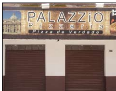
PIZZARIA BEM MONTADA NO CENTRO DE CALDAS NOVAS EQUIPAMENTOS DOS NOVOS NEGOCIO DE OCASIÃO NO CENTRO DA CIDADE