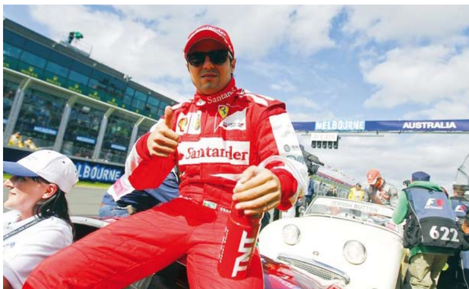
Felipe Massa terminou em quarto lugar no GP da Austrália

Os pilotos da Ferrari conseguiram manter ou melhorar suas colocações da largada em Melbourne. Felipe Massa saiu em