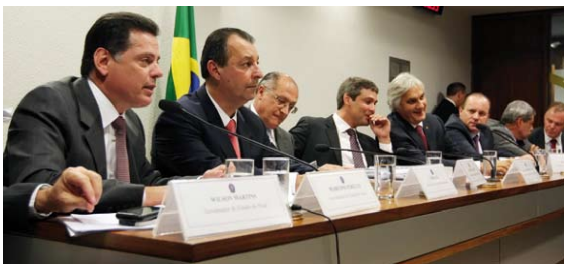
Rodada de debates antecipa votação que decide a unificação gradual das alíquotas do Imposto.

A Comissão de Assuntos Econômicos do Senado realizou na manhã de ontem, com início às 10:00h, mais uma rodada de debates antes de votar, no dia 26, o projeto de resolução PRS 1/2013 que unifica gradualmente as alíquotas do ICMS até 2025. Página 5.