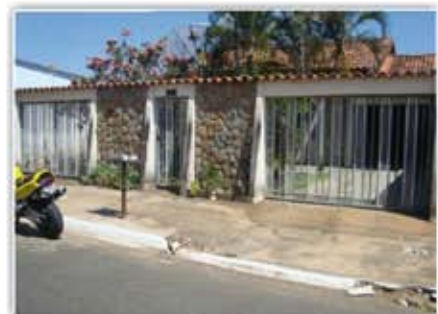
Casa no Itanhanga casa com ótima localização