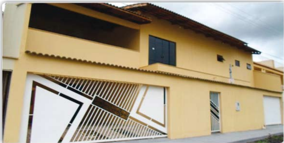
Sobrado NOVO, com 3 quartos sendo 1 suíte, sala, cozinha, banheiro social, área de serviço, varanda e garagem, situado a Rua 21 de Abril, setor Bandeirantes (Preço de Ocasão).

Fone: (64) 3453-6006 Av. Antônio Sanches Fernandes Qd. 12 Lt. 01 - Itaguaí I