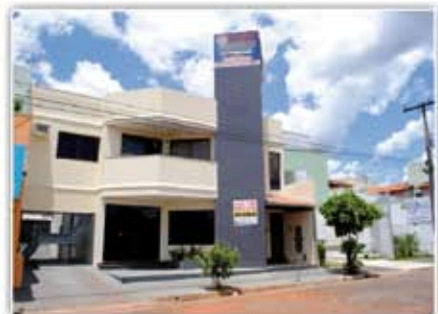
Sobrado no Setor Bandeirantes. Comercial e Residencial área livre do terreno 420 mts², área construída 450 mts² apto com 3/4 e 1 suíte com hidro.