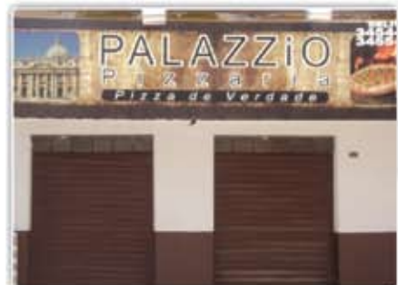
Pizzaria bem montada em uma ótima localização, situada no Centro de Caldas Novas Negócio de Ocasião.