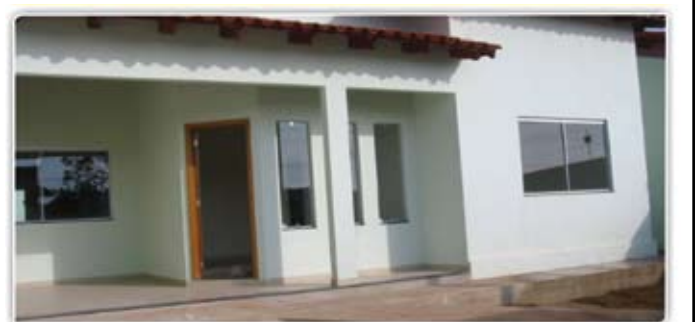
CALDAS DO OESTE: Casa com 3/4 sendo 1 suíte, 1 wc social, 1wc externo, sala de estar, copa, coz, área de serviço, dispensa, garagem e um amplo quintal. terreno com 492 n² e 140m² de área construída de alto padrão com porcelanato e blindex. confira o valor!

OPORTUNIDADE DE ALUGUEL PAINEIRAS - Apto de 3 quartos sendo 01 suíte, 02 WC, sacada, sala, cozinha, área de serviço e garagem, exelente localização.