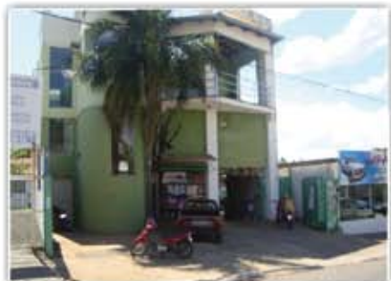
Ponto Comercial na Avenida Bento de Godoy