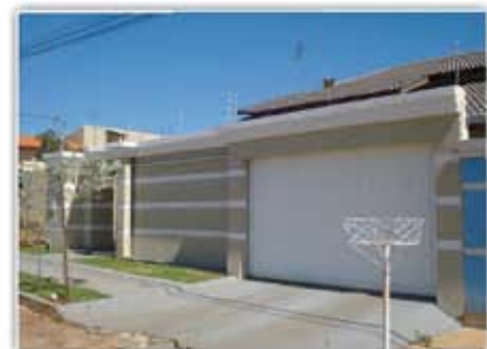
Casa - 3/4, 2 suíte, 2 WC, Sala, Copa, Coz., Área de serviços, portão eletrônico, Churrasqueira, lavanderia, acabamento de primeira e garagem para 4 carros

Sítio com Área 10 Alqueires e 400 M do asfalto. Casa 1/4, Banheiro, Área lateral, Abastecimento da Casa ( Poço Artesiano) e do Gado Nascente, a rvores Frutíferas. 21 Km do Trevo Saída para Marzagão