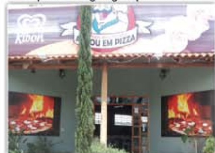
Ponto Comercial - Pizzaria e Restaurante, salão para 60 jogos de mesas, Play Ground, Buffet com 10 cubas quentes, e 14 frias, Churrasqueira na brasa etc...