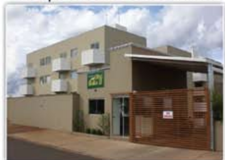
Apartamento Residencial Ilha Bella II. 2/4, guarda-roupas embutidos, estacionamento e recepção 24h.