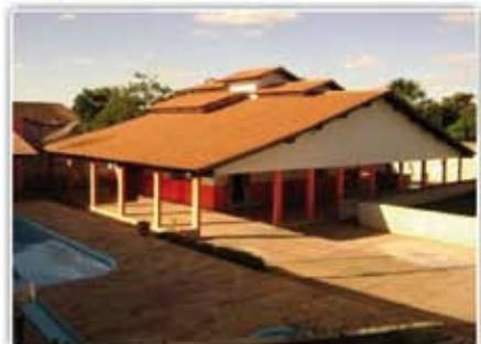
Casa em três lotes com 4/4, 2 suítes, 2 WC, sala, copa, varanda, churrasqueira, barzinho, quadra poliesportiva, campo society, piscina, cozinha, área de serviço.