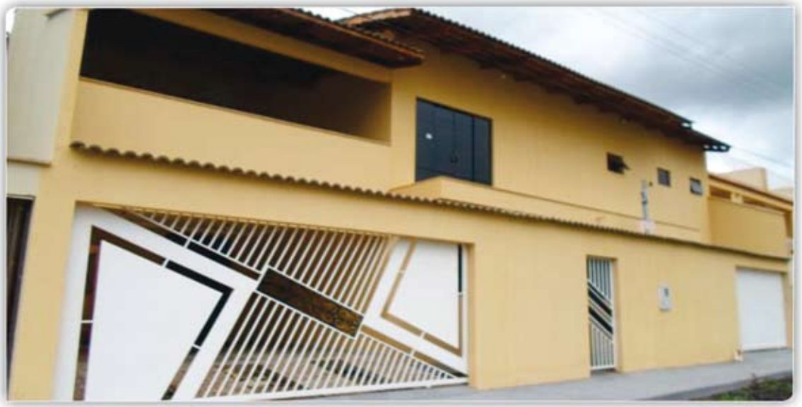
Sobrado NOVO, com 3 quartos sendo 1 suíte, sala, cozinha, banheiro social, área de serviço, varanda e garagem, situado a Rua 21 de Abril, setor Bandeirantes (Preço de Ocasão).

Fone: (64) 3453-6006 Av. Antônio Sanches Fernandes Qd. 12 Lt. 01 - Itaguaí I