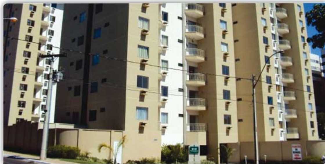
Apartamento todo mobiliado, 2 quartos sendo 1 suite, sala/cozinha, banheiro social, sacada, garagem, amplo parque aquático com piscinas, sauna, área com churrasqueira.

Pagamentos de boletos de qualquer valor e contas de água, energia, telefone, saques, depósitos, extratos até as 17:00 Hrs, no Shopping CTC, ao lado da Ricardo Imóveis.