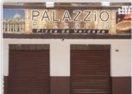
Pizzaria bem montada em uma ótima localização, situada no Centro de Caldas Novas Negócio de Ocasão.