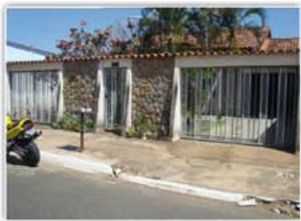
Casa no Itanhangá casa com ótima localização