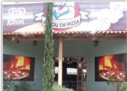
Ponto Comercial - Pizzaria e Restaurante, salão para 60 jogos de mesas, Play Ground, Buffet com 10 cubas quentes, e 14 frias, Churrasqueira na brasa etc...