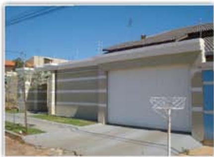
Casa - 3/4, 2 suite, 2 WC, Sala, Copa, Coz., Área de serviços, portão eletrônico, Churrasqueira, lavanderia, acabamento de primeira e garagem para 4 carros

RESTAURANTE "ACABOU EM PIZZA" - CENTRO DE CALDAS NOVAS