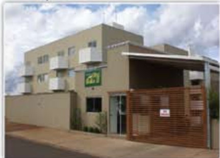
Apartamento Residencial Ilha Bella II. 2/4, guarda-roupas embutidos, estacionamento e recepção 24h.