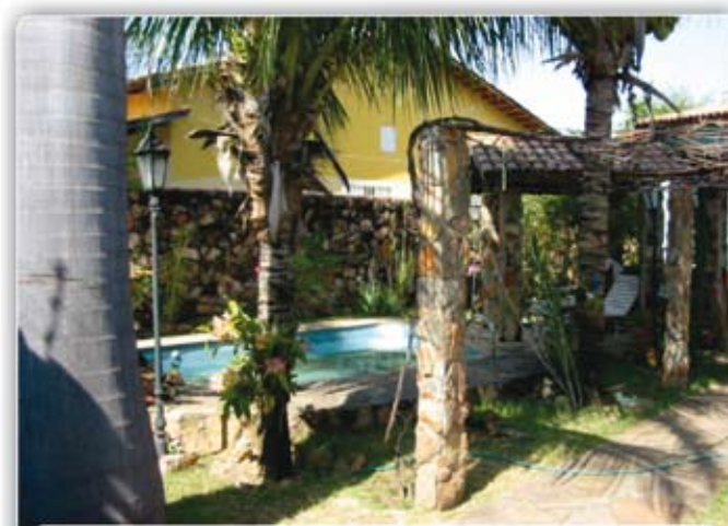
BANDEIRANTE - Casa de 2/4 suites, sendo 01 com banheira de hidromassagem e closet, cozinha, dispensa, área de serviço, sauna, jardim com piscina. Lote com 378m² em ótima localização, R$ 140 mil.

TANGARÁ - Chácara com 986m² no valor de R$ 15mil