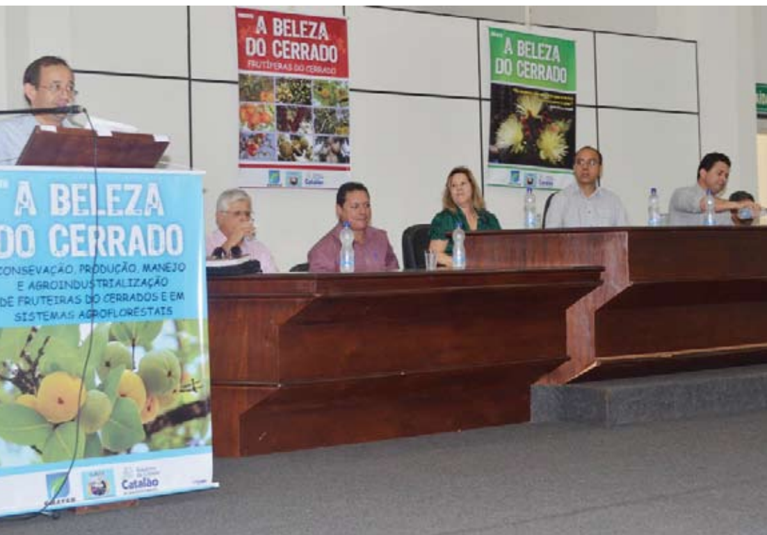
Catalão. Cerrado: Emater e Prefeitura discutem espécies nativas e sustentabilidade do bioma. Página 3.

Caldas Novas Secretaria Municipal de Cultura e Sindicato Rural realizarão curso de empreendedorismo