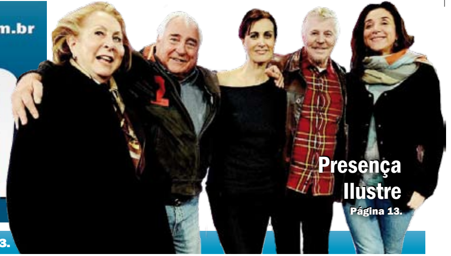
Presença Ilustre Página 13.

DIÁRIO - R$ 0,50 - Ano 8 - Número - 1.929 - Segunda-Feira, 10/06/2013.