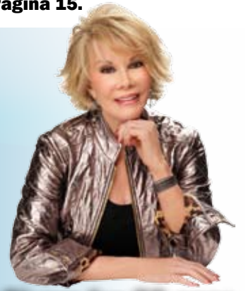
Joan Rivers faz 80 anos