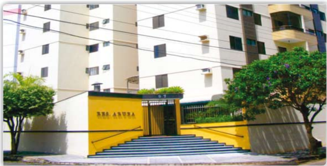
Aptº mobiliado, 3 quartos sendo 1 suíte, sala/copa, cozinha, banheiro social, dependência para empregada, área de serviço, sacada, garagem, área de lazer com piscinas, sauna e salão de festas, ótima localização no Centro da cidade, Residencial Aruba.

Lote com 1000 m², murado, próximo a Escola do Caldas do Oeste, R$ 120.000,00. Lote com 360 m² situado a Qd.46, Lt.23, setor Itaici R$ 60.000,00. ALUGUEL MATRIZ: 64-3453-5005 Apto semi-mobiliado, 2/4 sendo 1 suíte, sala/coz, WC social, área de serviço e garagem, em excelente localização no Centro, Residencial Monte Carlo, R$ 1.000,00 (já incluso condomínio). Apto mobiliado, 1/4, sala/coz, WC social, sacada, parque aquático, sauna, academia no Cond. Res. Splendor R$ 800,00 (incluso condomínio). ALUGUEL FILIAL 64-3453-6006 Apto 2/4 sendo 1 suíte, sala/cozinha, banheiro social, área de serviço e garagem, Condomínio Residencial Itaguai R$ 700,00 (incluso cond).