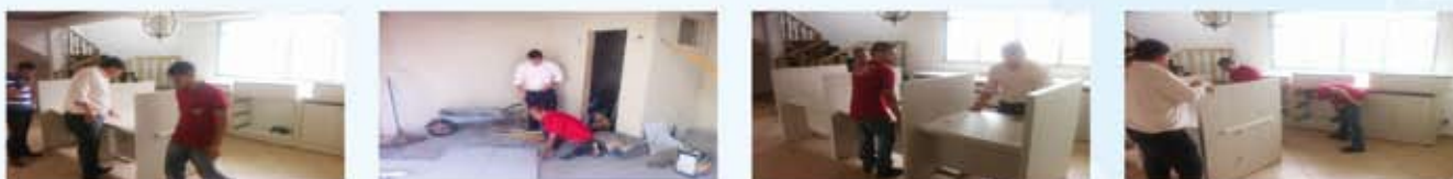
A Casa de Apoio foi fechada o ano passado. Agora, ela foi reconstruída e está nova para você

Nova Casa de Apoio de Caldas Novas, prova de respeito com a Saúde!